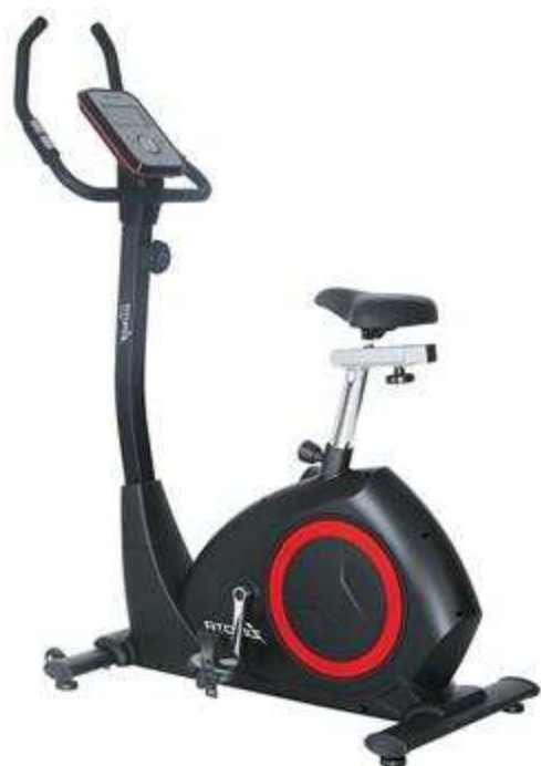
> Vélo B60