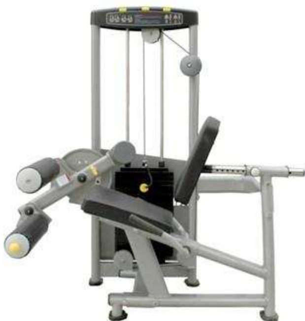
> S7- Leg Extension & Curl Machine