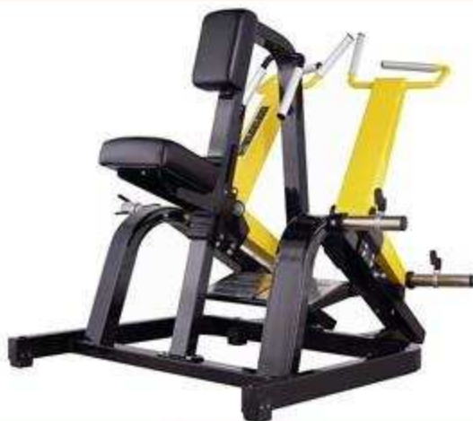
> FW6 Row