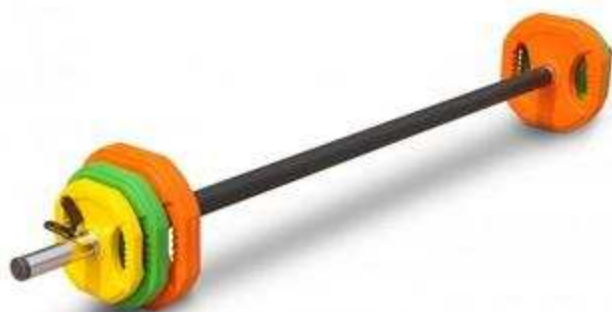
> Body Pump