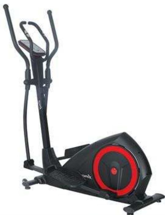
> Elliptique E61