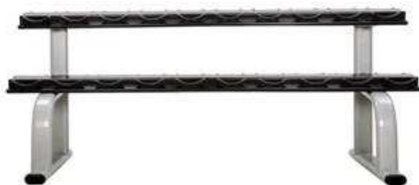
> B27- Vertical Knee Raise > B30- Dumbbell Rack(Support Haltère)