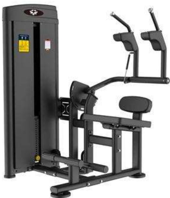
> M10- Abdominal machine