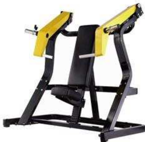
> FW2 Incline Chest Press