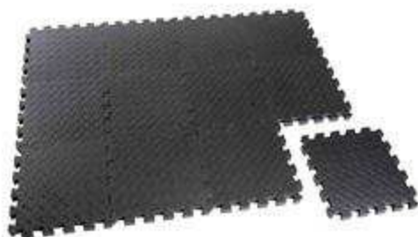
> Matelat Puzzle