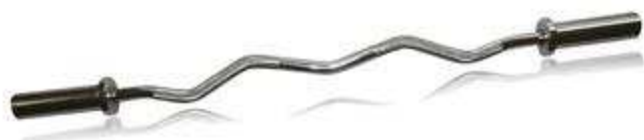
> B150C- Barre Curl 150 CM