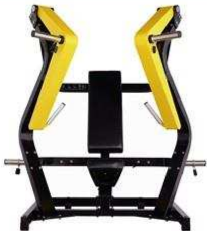
> FW5 Wide Chest Press