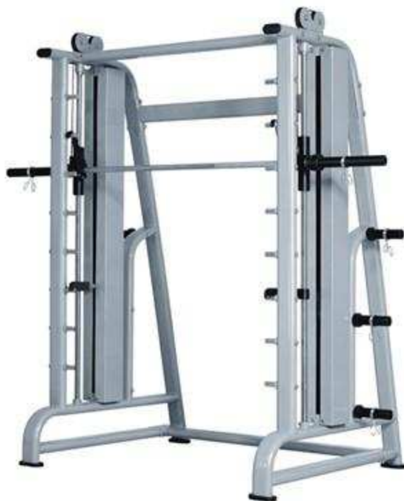
> M20- Smith Machine