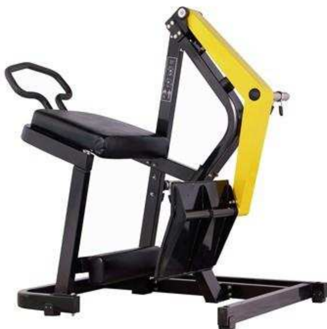
> FW8 Rear Kick