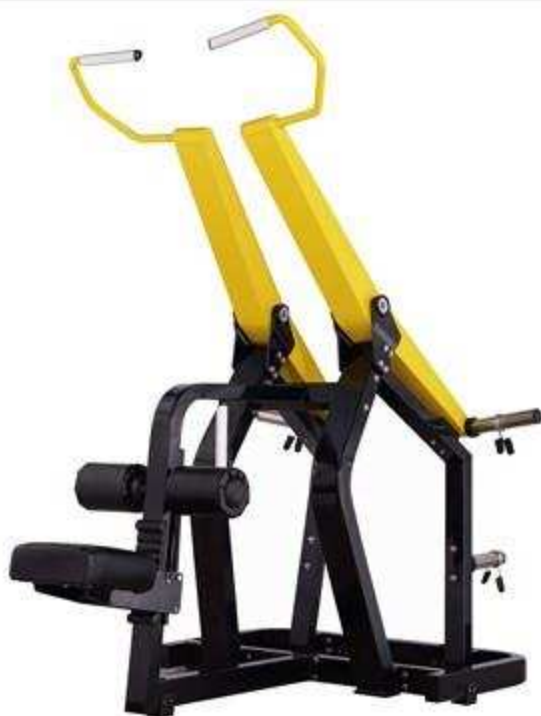
> FW7 Pull Down