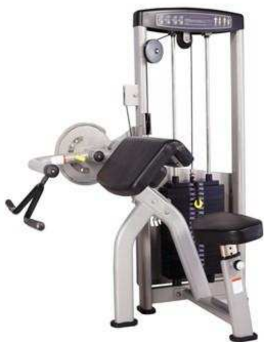
> S6- Biceps & Triceps