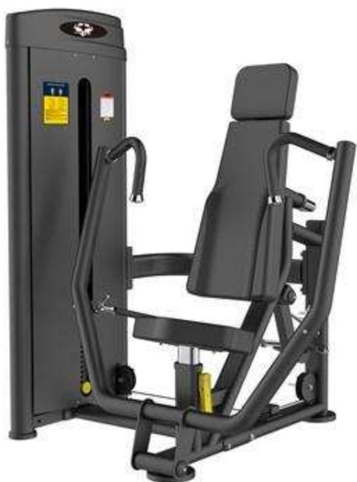
> M1- Seated Chest Press(Poitrine)