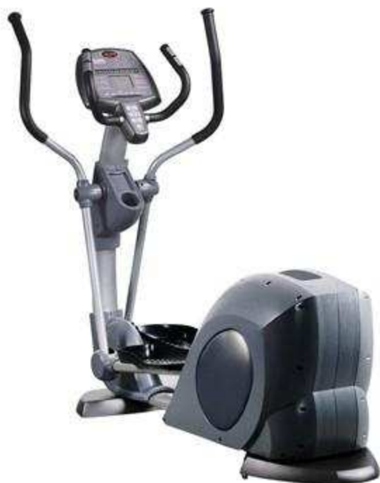
> Elliptique E71