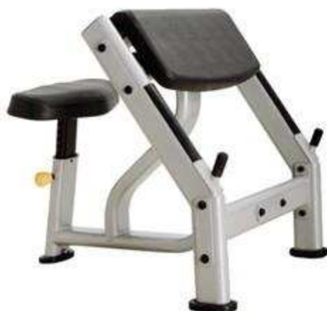
> B40- Scott Bench