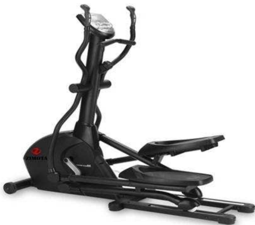
> Elliptique NB9