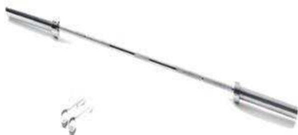
> B150- Barre 150 CM