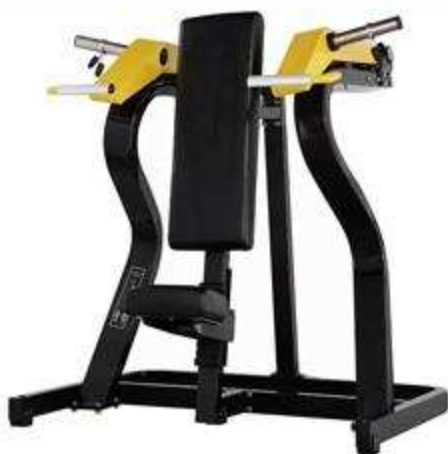
> FW3 Shoulder Press