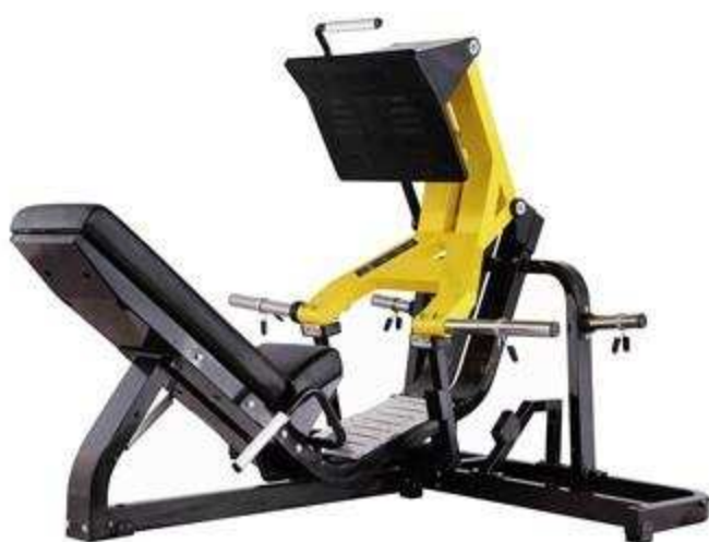
> FW9 Leg Press