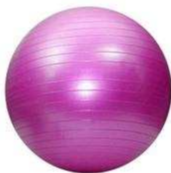
> Gym Ball