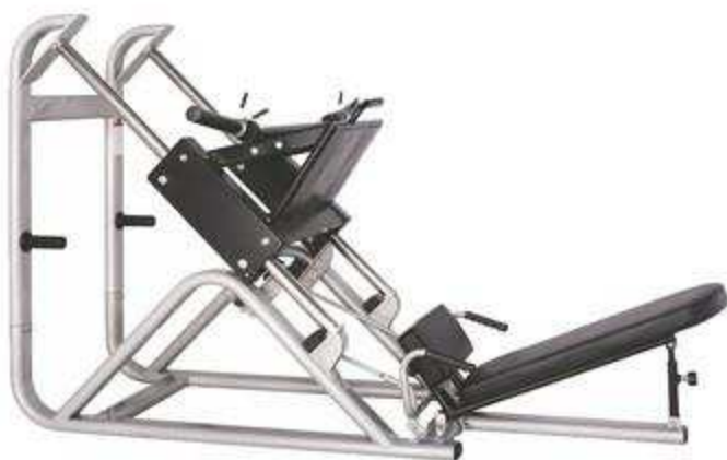
> M1819- Hip Abductor & Adductor