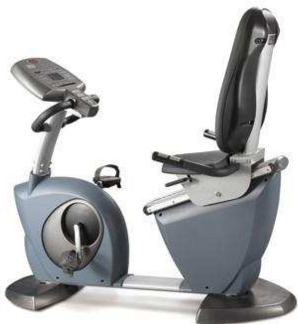
> Vélo R72