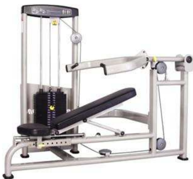
> S3- Multi Press