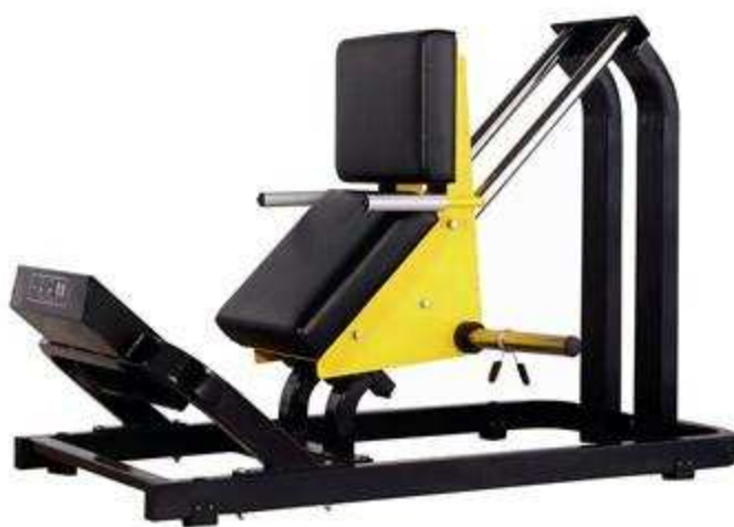
> FW10 Calf