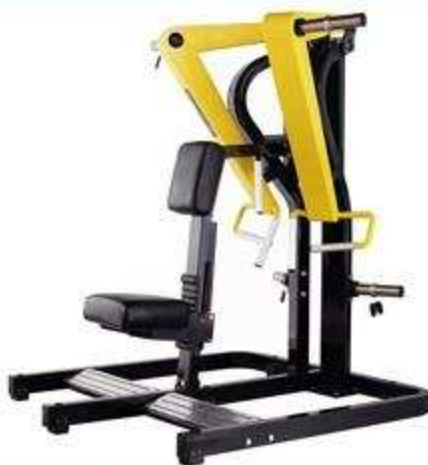
> FW4 Low Row