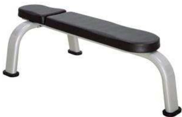
> B36- Flat Bench(Banc Couché)