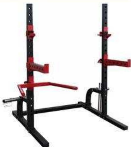
> B21- Squat rack