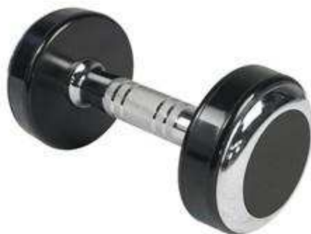
> H1- Haltère Pro