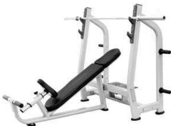
> B23- Weight Bench(Banc Couché) > B25- Incline Bench(Banc Incliné)