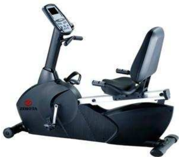
> Elliptique NB6