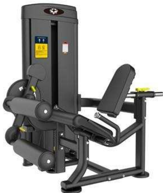
> M12A- Seated Horizontal Pully(Dorsaux) > M1314- Leg curl & extension (jambes)