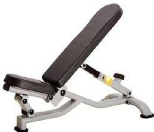
> B37- Multi Adjustable Bench(Banc Réglable)