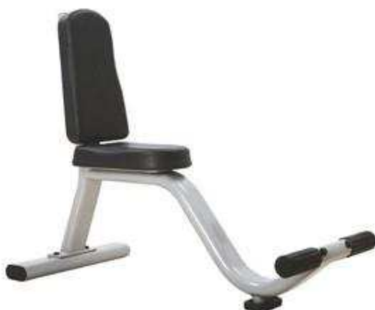
> B34- Adjustable Web Board(Banc Abdo) > B38- Utility Bench