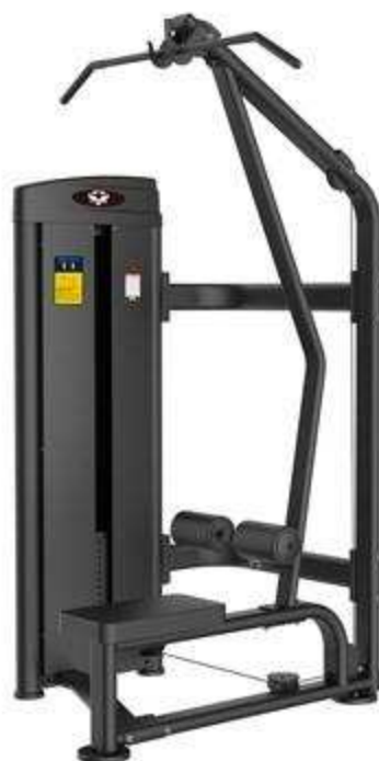
> M12- High Pully(Dorsaux)