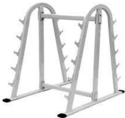
> B39- Barbell Rack