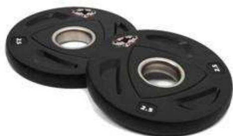
> D1- Disques PU