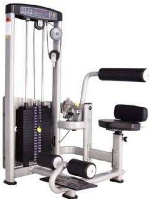
> S5- Abdominal Machine