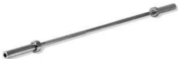
> B220- Barre 220 CM