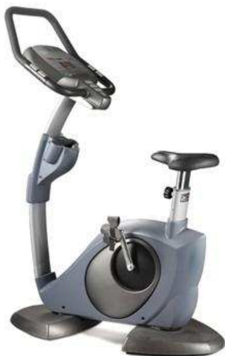
> Vélo B70