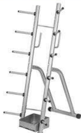
> B42- Body Pump Rack