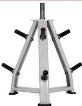
> B41- Weight Plate Tree