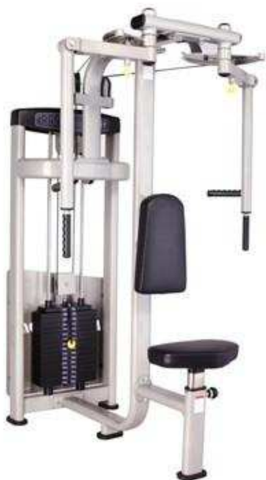
> S2- Straight Arm Clip Chest