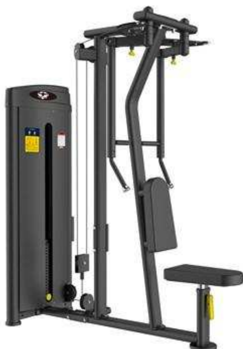
> M2A- Clip Chest (poitrine)