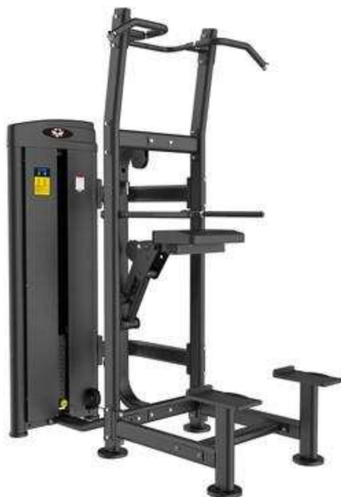
> M8- Upper limbs