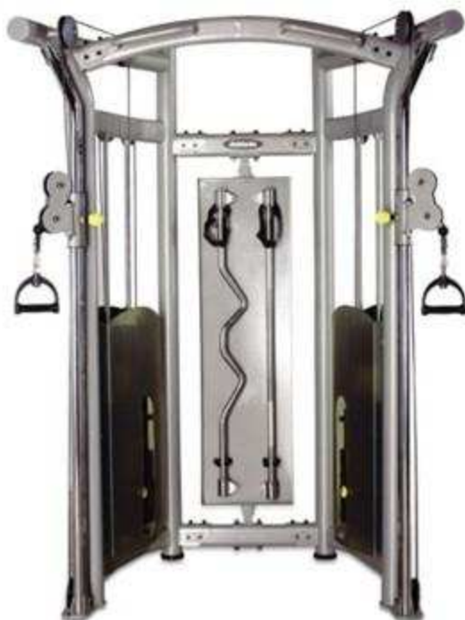
> S8- M5A Functional Trainer