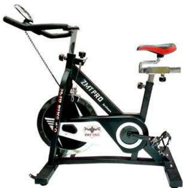
> Vélo SP04