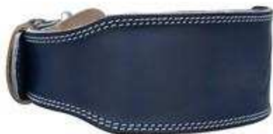
> Gant & Ceinture