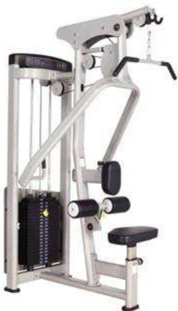
> S4- High Pully & Seated Row Machine