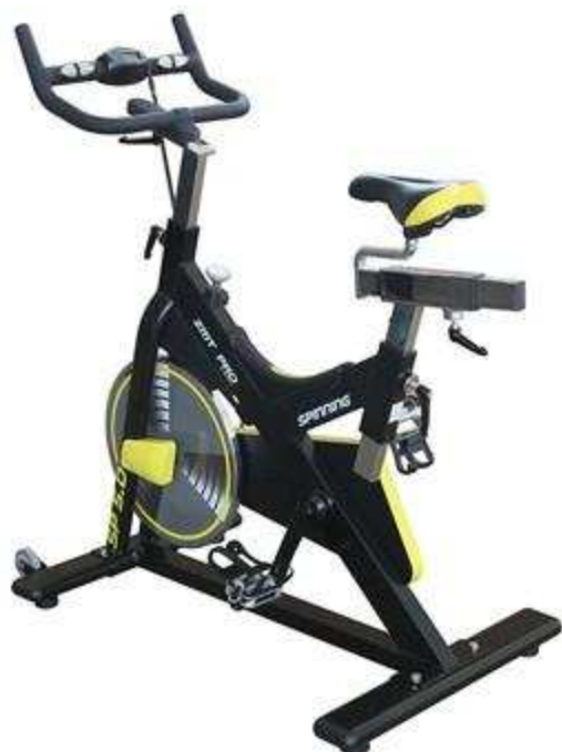
> Vélo SP05