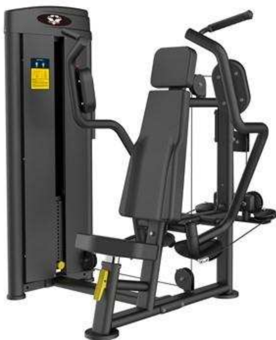
> M3- Shoulder Press(Épaule)