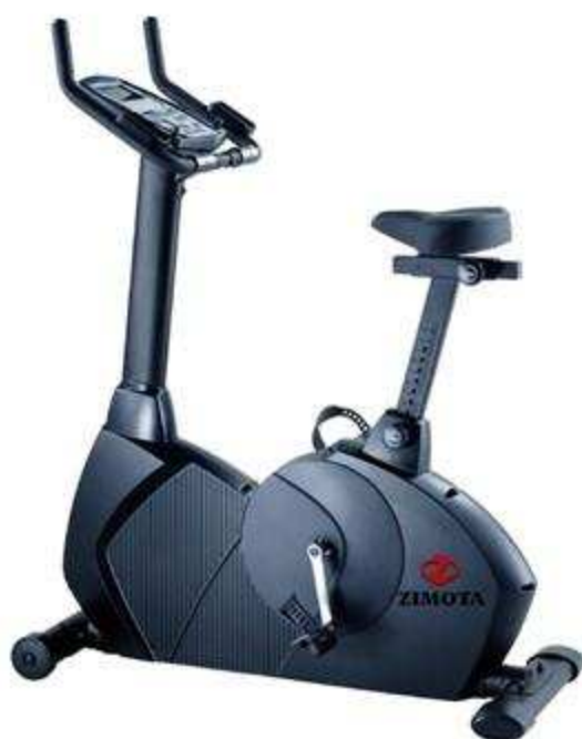
> Elliptique NB7