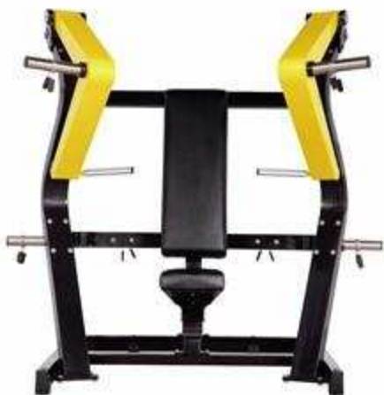
> FW1 Chest Press